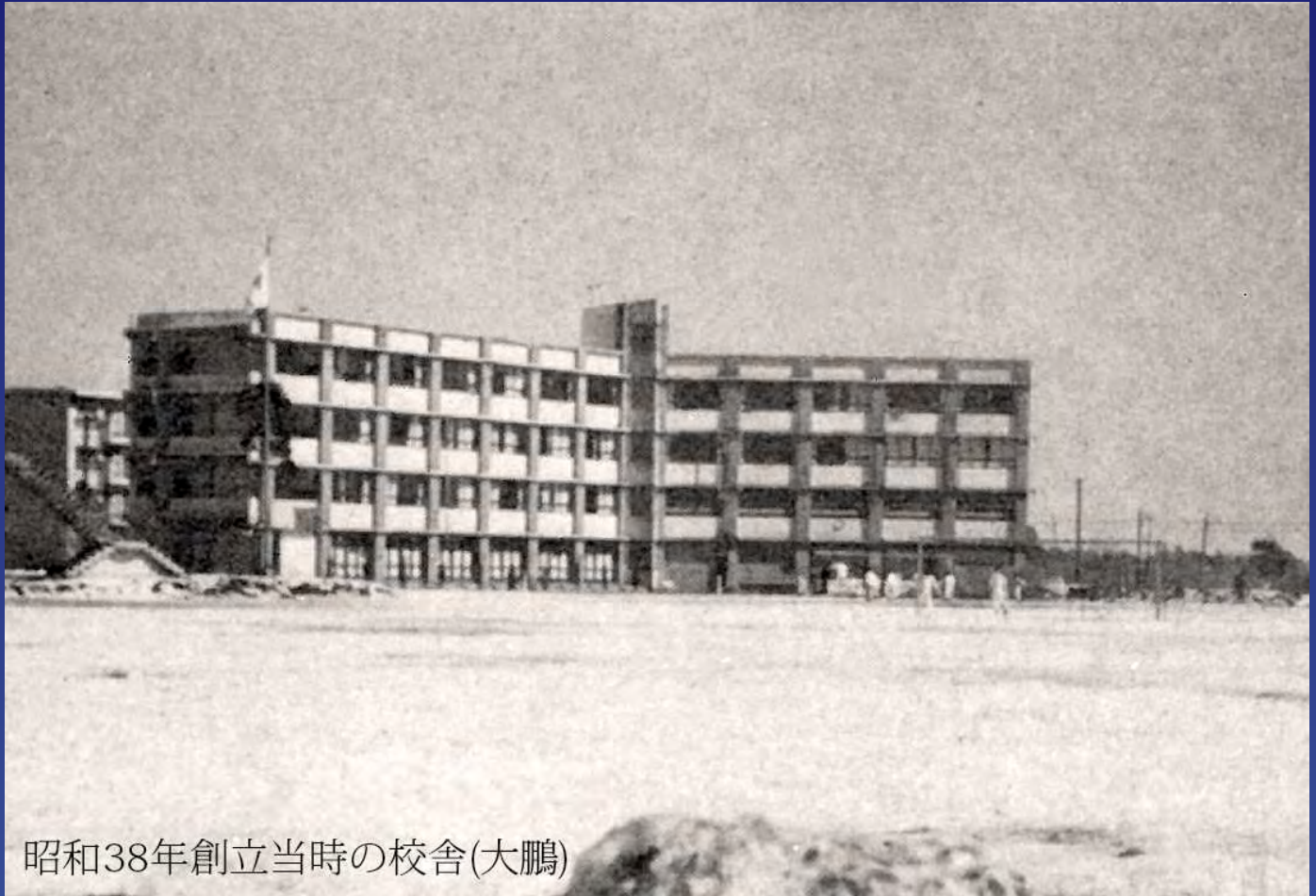
昭和38年創立当時の校舎(大鵬)